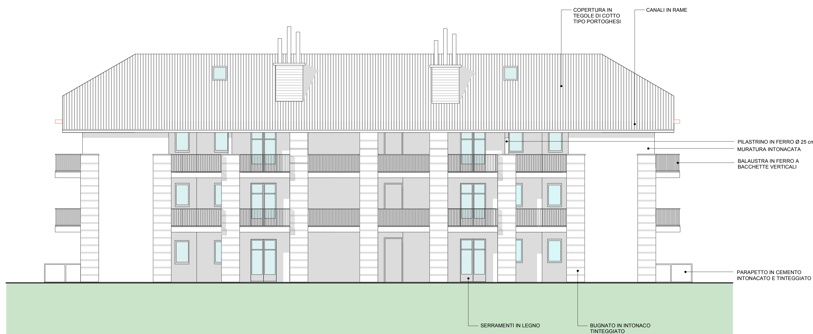
PROSPETTO OVEST VERSO MONTE SCALA 1/100