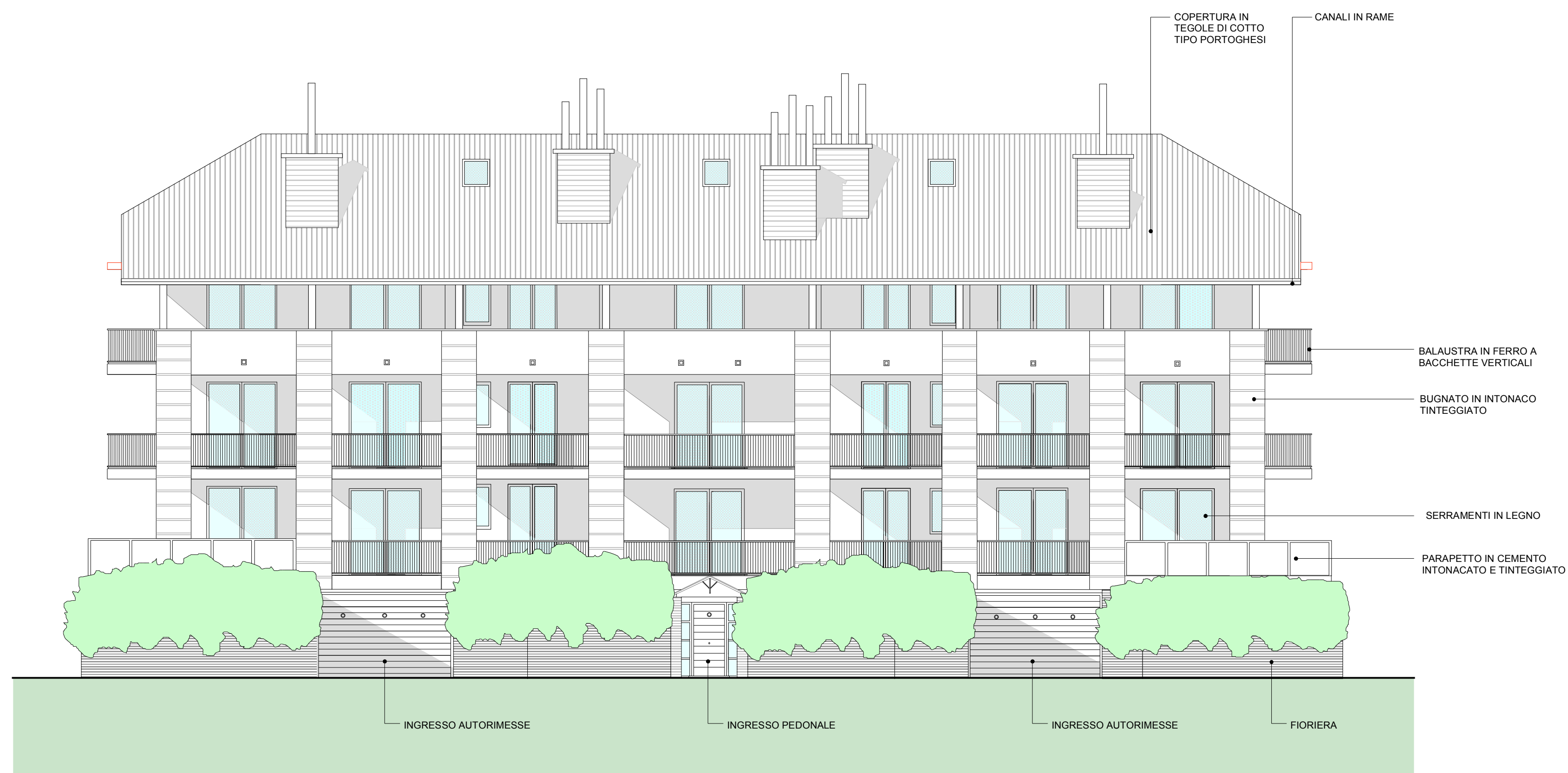
PROSPETTO EST VERSO LAGO SCALA 1/100